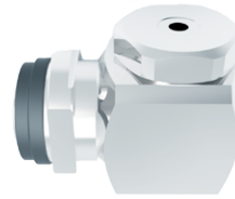
标准喷头 / 中小流量