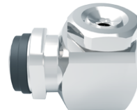
标准喷头 / 中小流量